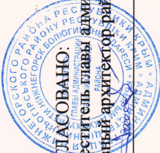
Схема размещения нестационарных торговых объектов и нестационарных объектов для оказания услуг на территории Емельяновского сельского поселения Нижнегорского района Республики Крым (текстовая часть)

СОГЛАСОВАНО Заместитель главы администрации - Главный архитектор района Л. У. Мамедьяев